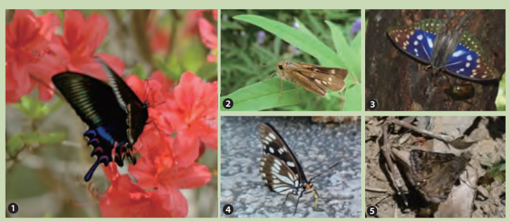
写真：減少傾向がみられた①ミヤマカラスアゲハ／②イチモンジセセリ ③オオムラサキ／④ゴマダラチョウ／⑤ミヤマセセリ