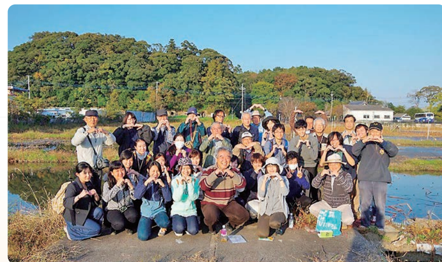
昨年度のエクスカッション集合写真