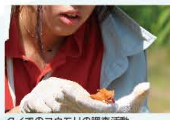
タイでのコウモリの調査活動