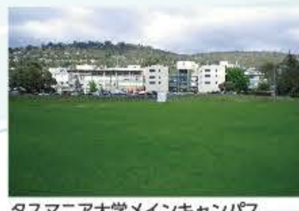
タスマニア大学メインキャンパス

自然保護寄附講座は海外で活躍できる人材を育成する一環として、交流協定締結校などへの留学を勧めています。特に 2015・2016 年に、オーストラリアのタスマニア大学やディーキン大学との交流協定が結ばれ、各大学に年間 3 名相当の留学生交換を行うことが可能になりました。タスマニア大学の周囲は、州の約 20% を占める原生地がユネスコの複合遺産に登録されているように、自然豊かな環境とそれを生活の場とする社会構造が混在し、自然保護の理論と実践を学ぶことができます。また、海洋や南極へのアクセスを生かした研究も盛んです。ディーキン大学は様々なコースを持つ総合大学であり、世界遺産学に関わるコースも持っています。また、次の世界遺産とも目されるグレートオーシャンロードに隣接するキャンパスもあり、海洋科学などの分野も盛んです。