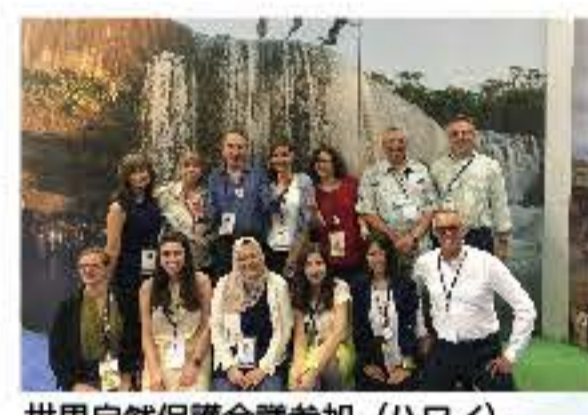
世界自然保護会議参加（ハワイ）