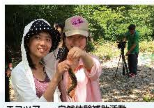
エコツアー・自然体験補助活動