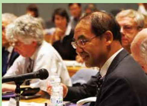
慶應義塾大学 名誉教授 鈴木正崇