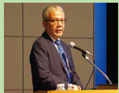
マレーシア工科大学 教授 アムラン・ハムザ

2018年度も「災害と回復力」をテーマに自然と文化の 関係に関するワークショップを開催する予定です。