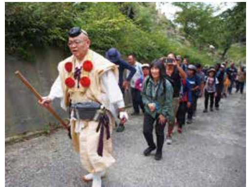
奈良県吉野にある大峯奥駈道を歩く おみなえくがけみち

第2回目は、「神聖な景観」をテーマに、富士山や紀伊山地のように自然への畏敬の念から信仰の場となった文化遺産や、神聖な価値を持った自然遺産における自然と文化の関係に配慮した遺産管理、観光管理などを学びました。主にアジア・太平洋地域からの16人の参加者と、自然保護寄附講座「自然保護特別実習1」を受講する5人の筑波大学大学院生が参加して、ICCROM、IUCN、ICOMOSの専門家から神聖な景観の保全・管理に関する基礎を学ぶとともに、高野山、熊野、吉野を含む紀伊山地の霊場と参詣道を巡り、日本の経験を学びました。