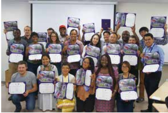
修了証を手に笑顔を見せるアジア・太平洋地域の若手専門家と自然保護寄附講座履修生

2017年9月15日から26日、筑波大学世界遺産専攻・自然保護寄附講座の共催で、第2回アジア・太平洋地域の遺産保護における自然と文化の連携に関する人材育成ワークショップが開催されました。このワークショップは、アジア・太平洋地域の若手・中堅の遺産管理関係者を対象に、ユネスコ世界遺産センター、ICCROM（文化財保存修復研究国際センター）、IUCN（国際自然保護連合）、ICOMOS（国際記念物遺跡会議）の協力を得て実施しており、ユネスコ高等教育局からユネスコチェアプログラムの認定を受けました。