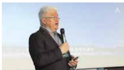
A 「オーストラリアにおける民間保護地域：成果と展望」について講演するマイケル・ロックウッド博士(タスマニア大学)