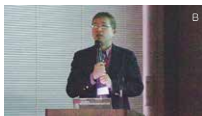
B 柴崎茂光博士(国立歴史民俗博物館)による講演「保護地域制度は地域社会にとって創造的破壊なのか?それとも破壊的創造なのか?」