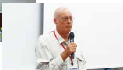
E ラルフ・バックリー博士(グリフィス大学)による講演「地域と自然とを結ぶ架け橋としてのエコツーリズム」