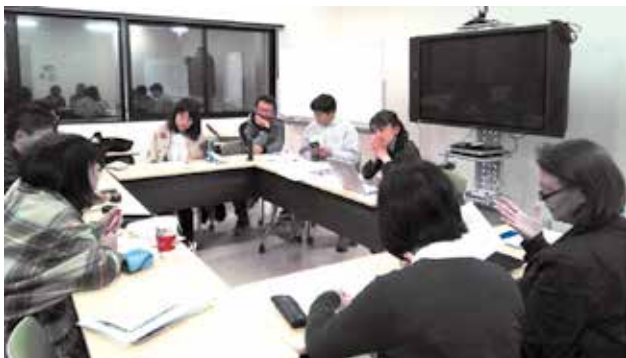
シンポジウム当日のスタッフの動きを慎重に検討

然観察の森に、事前勉強をかねたエクスカージョンに行きました。これはRA2名が企画してくれたもので、とても楽しい会となりました。秋には外部講師の方をお呼びしてのセミナーも行いました。開催直前は、資料作成、ポスター準備、講演者の方との調整に追われ、ほとんど力業で乗り切った感があります。当日は多くの方にご参加いただき、また素晴らしいご講演を聞くことができ、大変貴重な経験となりました。ご協力をいただきました全ての皆様に心より感謝申し上げます。