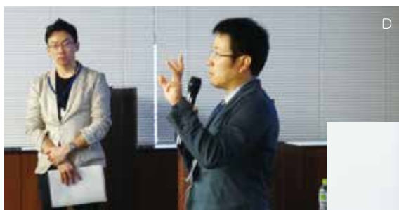
D 綾ユネスコエコパークでの照葉樹林保護の取り組みについて紹介する河野円樹博士(右)