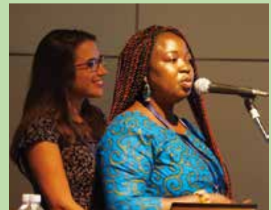
ガーナとフランスからの参加者による プレゼンテーション