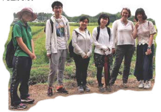
エクスカージョンでの記念写真