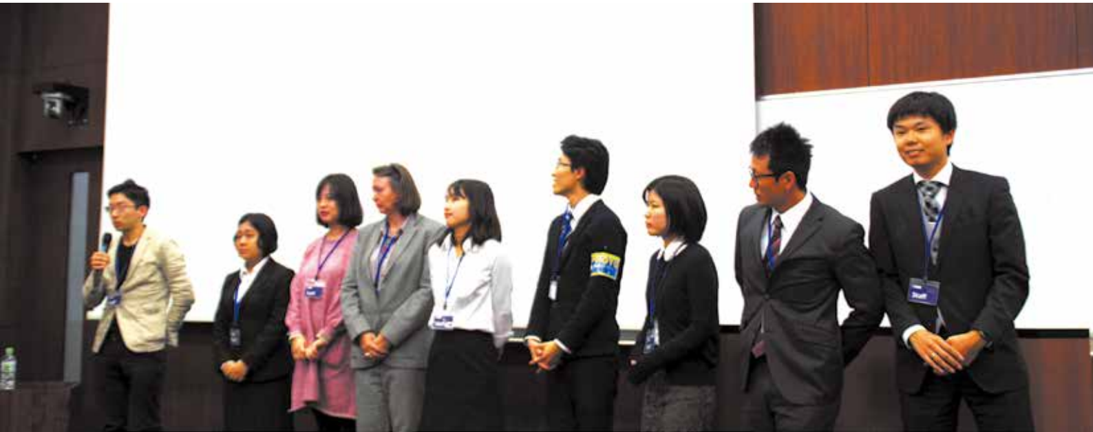
国際シンポジウム「地域に根差した自然保護」で全国から詰めかけた120名の参加者へ御礼や感想を述べる履修生