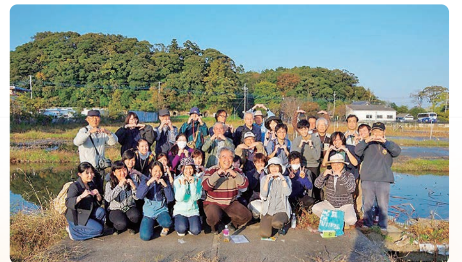
昨年度のエクスカッション集合写真