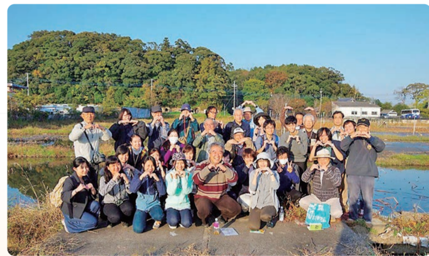
昨年度のエクスカッション集合写真